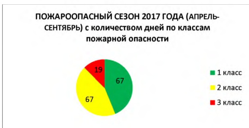
Рис. 2. Пожароопасный сезон с количеством дней по классам пожарной опасности по условиям погоды.

Наибольшую опасность для лесной среды представляют лесные пожары, они нарушают экологическое равновесие, сукцессионные процессы после крупных лесных пожаров растягиваются на столетия. Мониторинг пожарной опасности по условиям погоды – один из видов мониторинга, осуществляемых на территории национального парка. Пожароопасный сезон 2017 года характеризовался низким классом пожарной опасности – «2» (Рисунок 2), большим количеством осадков, что является благоприятным фактором для лесных биогеоценозов.